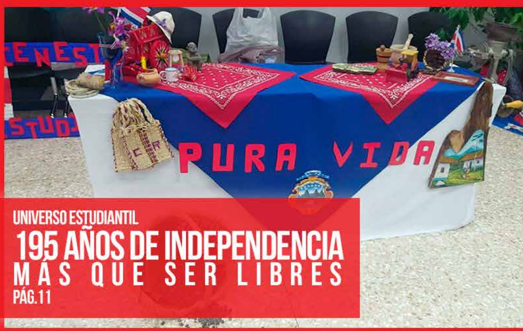
UNIVERSO ESTUDIANTIL 195 AÑOS DE INDEPENDENCIA MÁS QUE SER LIBRES PÁG.11