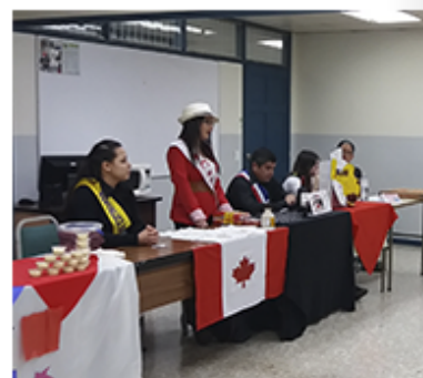
Los alumnos de Negocios Internacionales demostraron estar listos para participar en una cumbre.

Las grandes potencias comerciales como Estados Unidos y Canadá marcaron el terreno a los más débiles, mientras estos intentaban combatir las barreras de la indiferencia comercial.