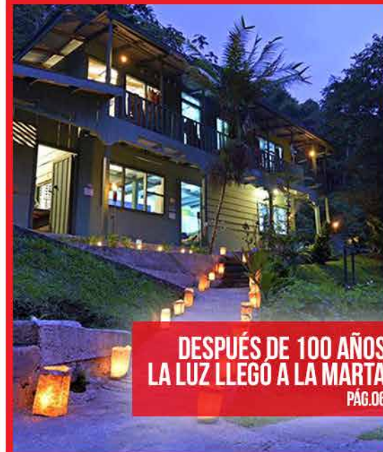
DESPUÉS DE 100 AÑOS LA LUZ LLEGO A LA MARTA PÁG.06