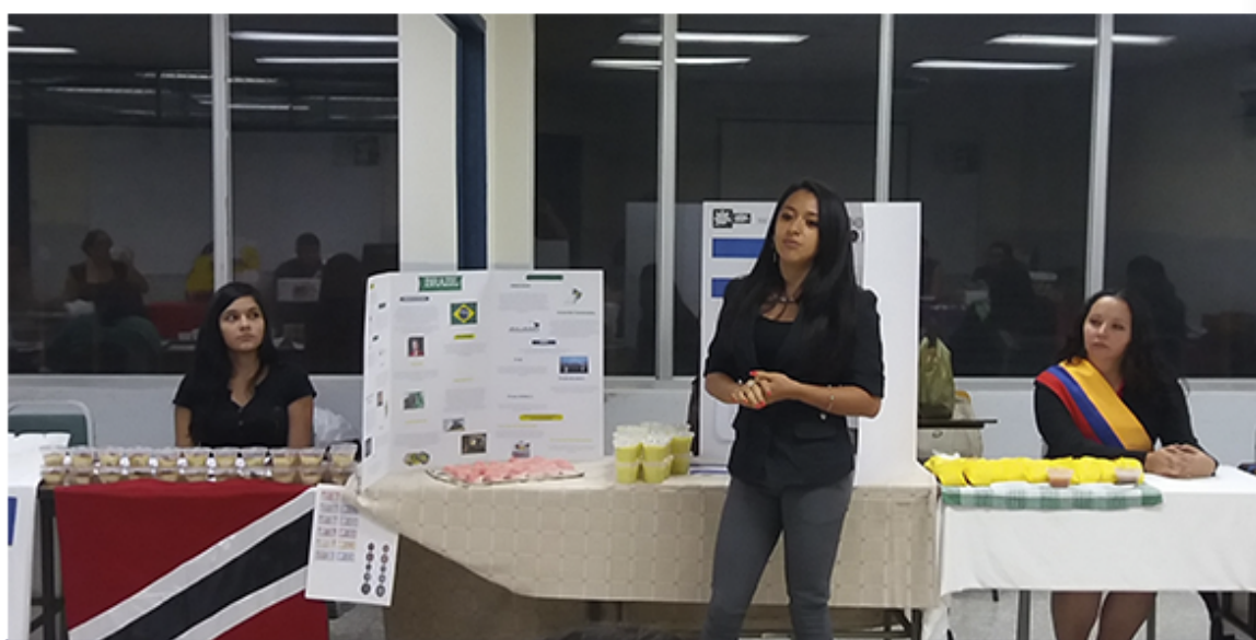
Cada estudiante representó a un Estado del continente americano.

La actividad se realizó el pasado 25 de agosto, en el edificio Murray, donde cada alumno se dio a la tarea de encarnar el papel de un Ministro de Comercio Exterior de un país miembro de la Organización Mundial del Comercio (OMC).