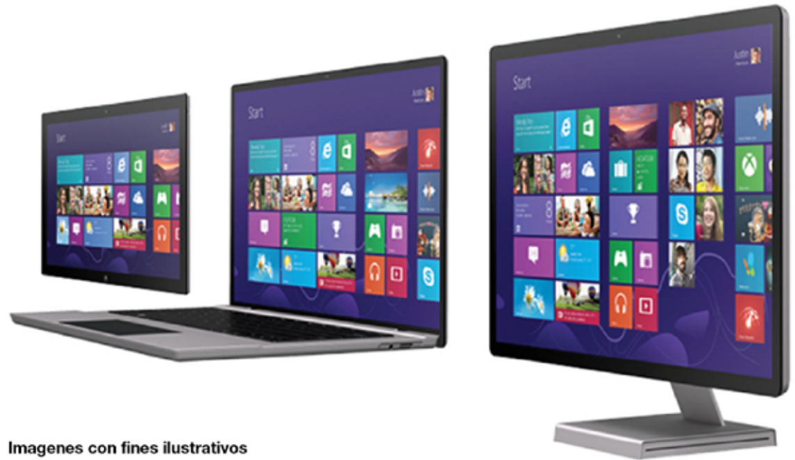
Imágenes con fines ilustrativos

Craig Bruce dijo en los años 90 que “El hardware es lo que hace a una máquina rápida; el software es lo que hace que una máquina rápida se vuelva lenta”, entendiendo que el hardware se refiere a la parte física de la computadora y el software propiamente a las aplicaciones. Esta frase no ha perdido vigencia, pero hay algunos tips que nos pueden ayudar a mejorar el rendimiento de nuestro equipo utilizando correctamente la tecnología, por ejemplo: