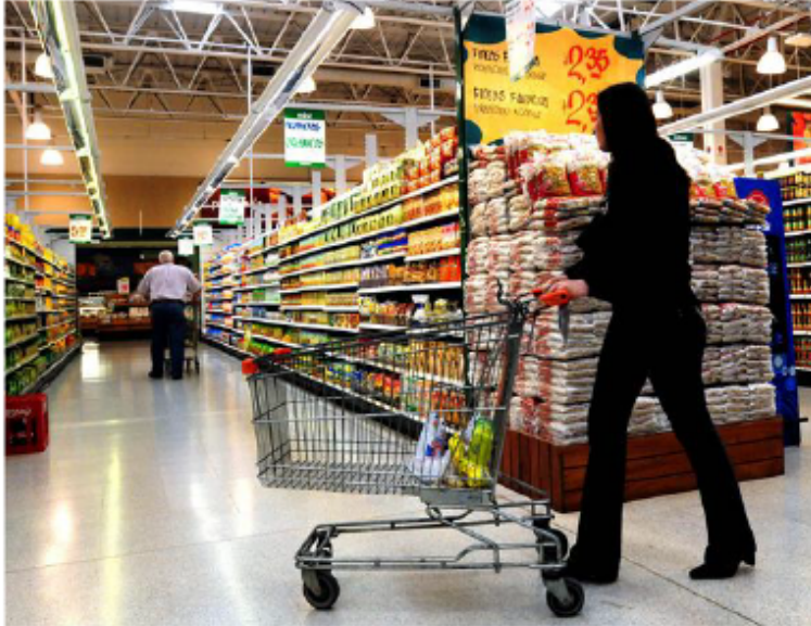
EL IVA pretende ampliar el actual impuesto de ventas para recaudar más dinero.

La propuesta del gobierno de pasar de un impuesto de ventas a uno de valor agregado o IVA, implica cambios que repercuten en nuestra economía y que tienen dividida a la opinión pública.