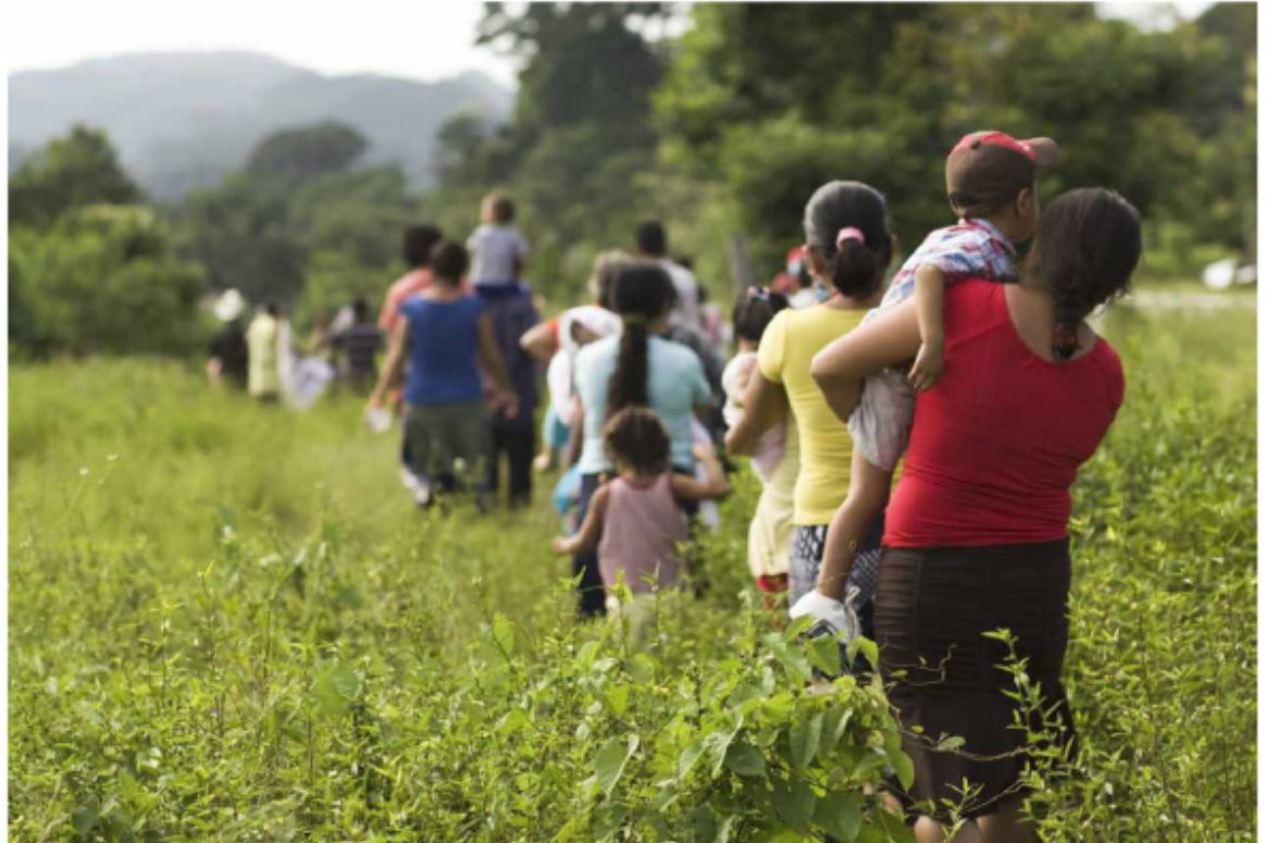
Imágenes con fines educativos e ilustrativos.

Según esta misma fuente, el 9% de la población total en 2013 era de origen extranjero.