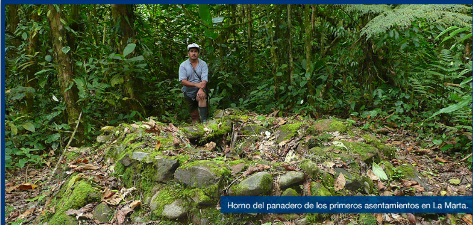
Horno del panadero de los primeros asentamientos en La Marta.