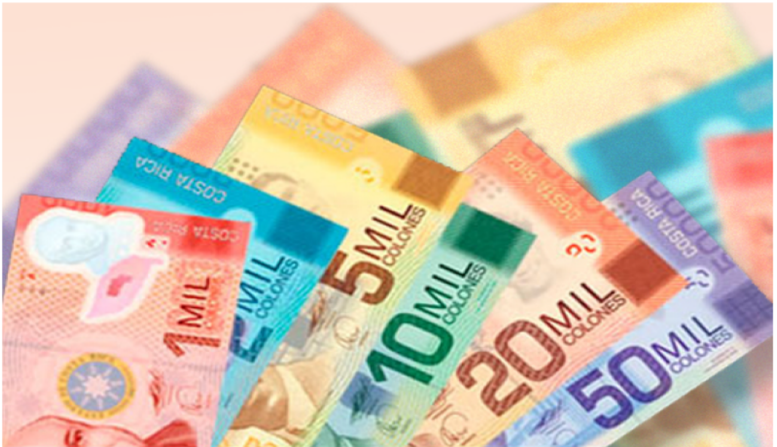
Actual sistema Tributario del país es de los años ochentas.

ta el impuesto que le cobra su vendedor, en ese caso el IVA establece que para calcular el impuesto a pagar por el empresario que vendió bienes o presta servicios es que debe tomar el monto que cobró a su adquirente y restar los impuestos que le cobraron cuando él fue adquirente, esa diferencia entre el débito y el crédito es lo que se le paga a Hacienda, esa es la mecánica del IVA.