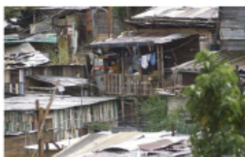
Pobreza en Costa Rica, un tema de todos.

La conmemoración del 17 de octubre también refleja la voluntad de las personas que viven en la pobreza, de utilizar