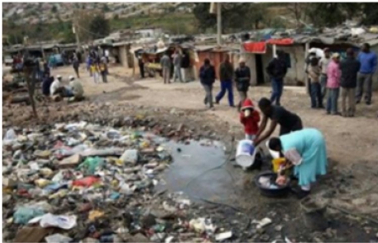
Pobreza extrema a nivel mundial.

Esta fecha representa una oportunidad para reconocer el esfuerzo y la lucha de las personas que viven en la pobreza, una ocasión para que den a conocer sus problemas y un momento para reconocer que las personas pobres son las primeras en luchar contra la pobreza.