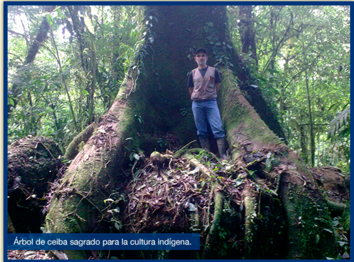
Árbol de ceiba sagrado para la cultura indígena.

Desde las alturas, sus raíces forman la figura de dedos, por lo que la leyenda dice que es una mano que descendió del cielo para decir: “esta tierra no se toca más”. Asimismo, tras lo destructivo que fue la avalancha, solo un instrumento quedó intacto y, hasta la fecha, lo mantienen en el mismo sitio donde se encontró: el horno del panadero del pueblo.