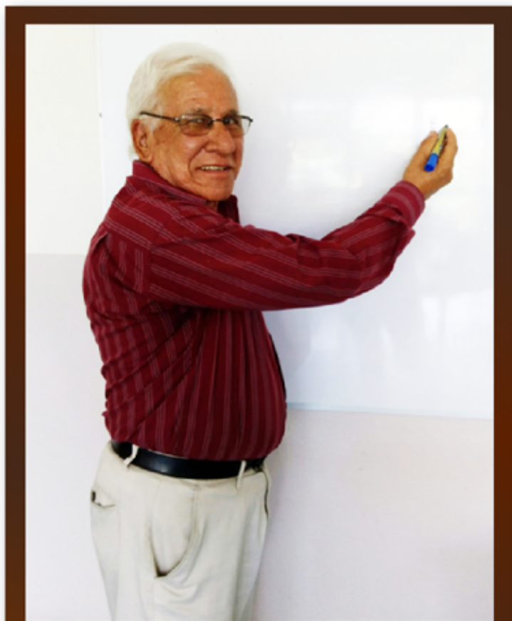
Su pasión siempre fue la enseñanza.

Hace poco estuve trabajando una antología sobre literatura para niños de primer ciclo y otra para segunda ciclo compuesta por cuatro subgéneros: leyenda, cuento, trabalenguas y adivinanzas. Por otro lado, quiero escribir un libro sobre didáctica universitaria. Vieras que lo había escrito, pero como no soy muy bueno con la computadora, lo perdí, así que quiero retomarlos. También, quiero escribir un libro para la metodología de la investigación y la didáctica. Pero por ahora, tengo que terminar algunas direcciones de tesis que aún tengo pendiente. Quiero disfrutar más la familia y hacer un poco de ejercicio, cosas que no he podido hacer por el trabajo.