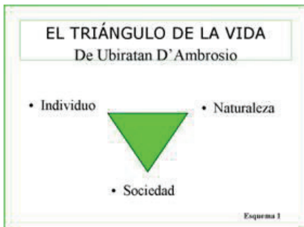
Figura Nº 2: El Triángulo de la Vida

D'ambrosio, según Badilla (2016), presenta la ilustración de la ecoformación como un triángulo vital básico en el que se articulan en un sistema de respeto y equilibrio los polos de la persona, la sociedad y la naturaleza.